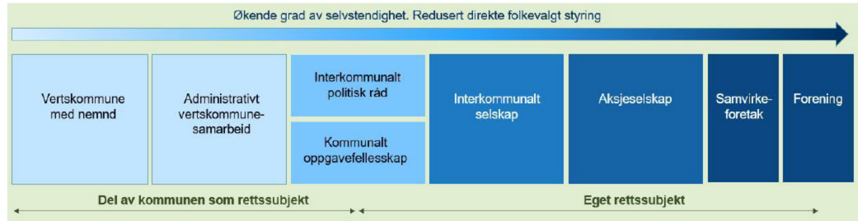
Figur 2.2 Lovfestete modeller for interkommunalt samarbeid

Veileder om interkommunalt samarbeid - regjeringen.no