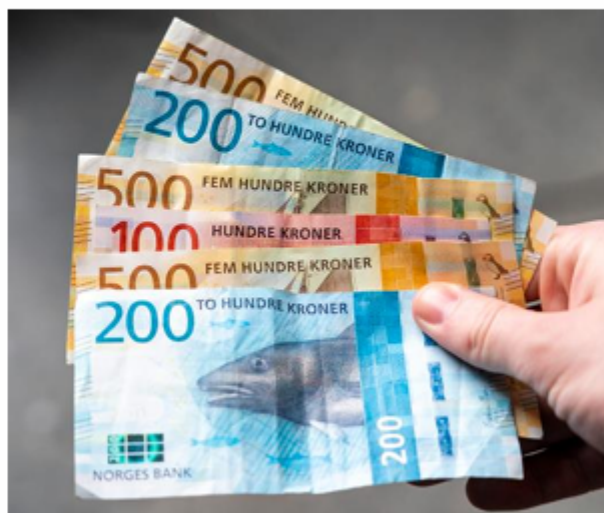
Bilde: penger – Store norske leksikon

Vegdirektoratet tar stilling til om prosjektet skal få nytt KVVU-estimat