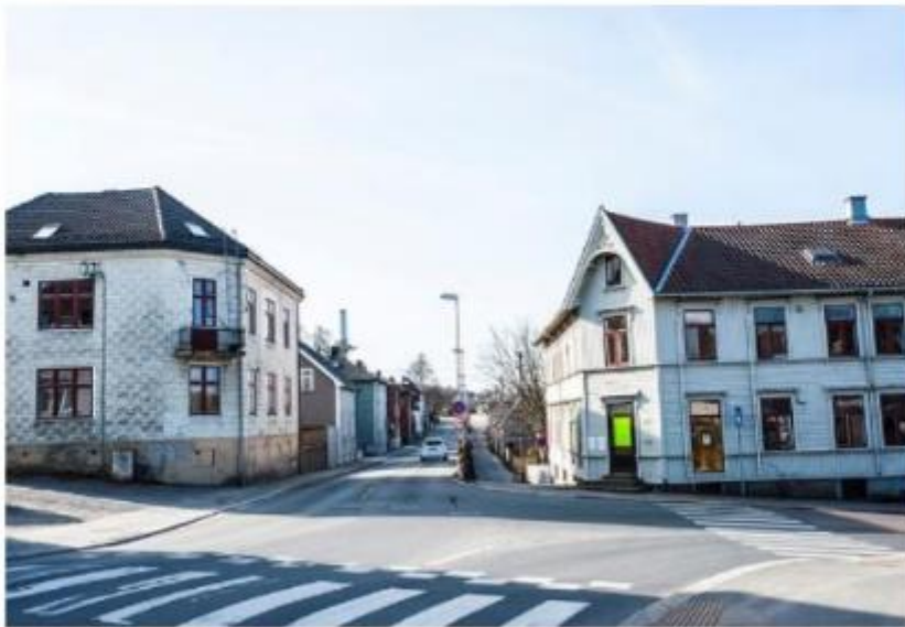
Riving av Nykvistbyen i Moss, før årskifte og etter nyttår