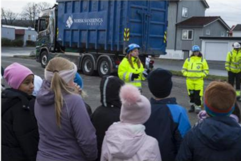
Informasjon om trafiksikkerhet for skole – og barnehage.