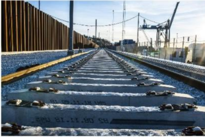
Midlertidige spor via Moss havn.