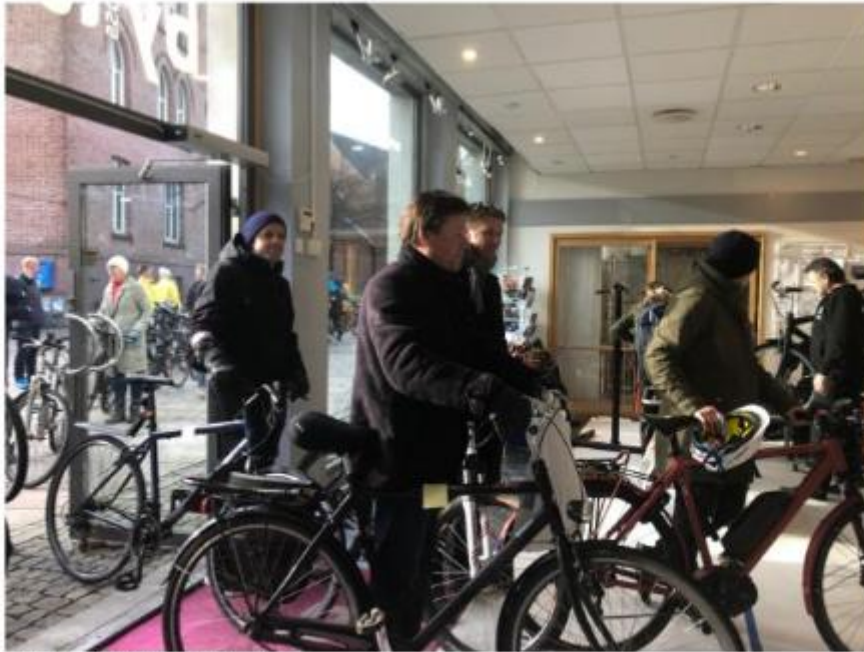
Bilder fra Vintersykkeldagen 2018.