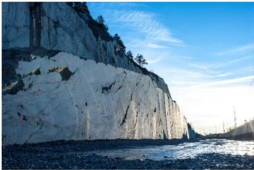
Fjellskjæring i Sandbukta, ferdig i desember 2018.

Bane NOR skal bygge 10 km dobbeltspor på strekningen fra Sandbukta i nord til Såstad i Rygge i sør, inkludert to tunneler og en ny jernbanestasjon i Moss. Forberedende arbeider startet høsten 2017. Planlagt byggestart for hovedarbeidene er 2019. Partene i samarbeidsavtalen har fått løpende informasjon om status for prosjektet. Dette har vært nyttig fordi konsekvensene har betydning for både kommuner, fylkeskommuner og Statens vegvesen.