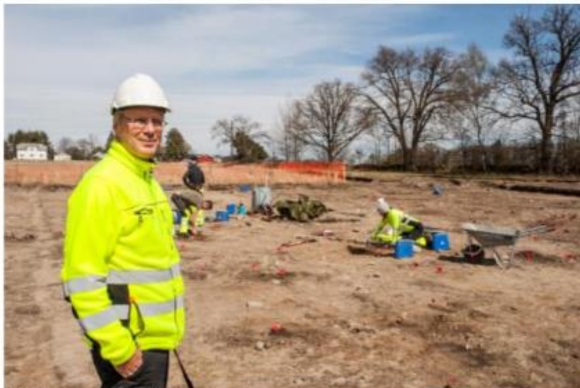
Bildet viser utgravninger på Dilling.