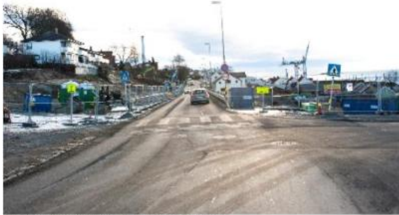
Riving av Nykvistbyen i Moss, før årskifte og etter nyttår.