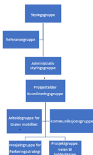
Figuren viser en oversikt over organiseringen i Miljøløfte Moss i 2020. Antallet prosjektgrupper varierer.

Samarbeidet mellom partene er organisert i en prosjektorganisasjon som beskrives under.