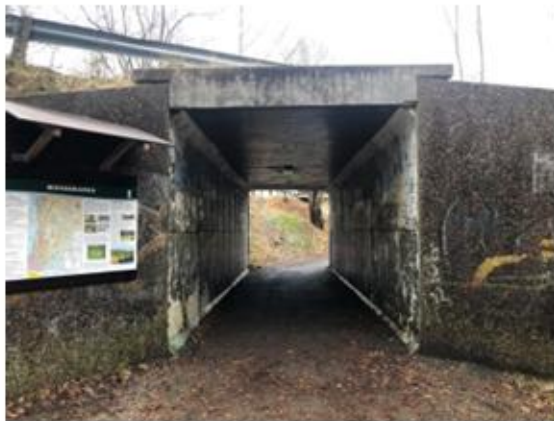
Bilde; undergang fra Åvangen skole. Det finnes rundt 10 underganger i kommunen i varierende tilstand. Uansett tilstand oppleves ofte underganger som utrygge.

Et stykke inn i arbeidet med prosjektet ble landet delvis stengt ned for å møte trusselen som lå i pandemien Covid-19. Bussene sluttet ikke å gå, men det ble oppfordret til å kun bruke dem hvis man absolutt måtte. Ett halvt år senere er det fortsatt slik at kollektivtransport regnes som en stor risiko for smitte, og man er forsiktig med å slippe opp tiltakene for mye rundt slike samlingsplasser. Det har et utslag på prosjektet som vi må være bevisst. Det er vanskelig å stimulere folk til å gå til holdeplassene hvis vi samtidig oppfordrer dem til ikke å bruke tilbudet. Vi må naturligvis ha for øyet at man før eller senere vil kunne gjenoppta kollektivtilbudet i det fulle, men ingen vet hvor langt frem dette ligger. Selv om vi fortsatt fokuserer på turen til holdeplassen, har vi valgt å løsne rammene litt med den antagelsen at bedring av veien til holdeplassen også er et løft for nærmiljøene, og at dersom folk kommer seg ut og ser slike forbedringer, vil det også kunne oppfordre til mer sykkel og gange. Vi er derfor mindre rigide på å ta inn tiltak som ikke er direkte i tråd med mandatet.