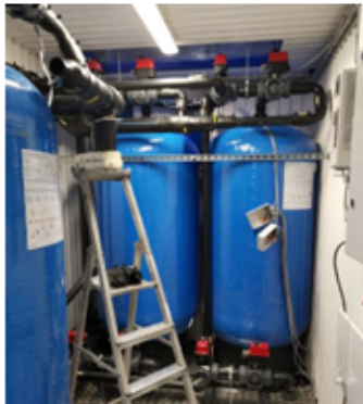
Figur 1. Bilder av filterenheter med kalsinert leire.

Prosjektet har strenge krav til rensing av anleggsvann/tunneldrivevann, og entreprenør har valgt å prøve ut et nytt filter av kalsinert leire (Filteralite) for å klare rensekrav. Filteret har god effekt på kobber og sink. Filteret er bygget opp av vannmettet kalsinert leire som absorberer kationer, anioner som metaller, fosfater og andre ladede, vannløste forbindelser. Dette er en prototype som fortsatt er under utvikling, og ikke et «hylleprodukt». Leverandør er ContainerTech. Tiltaket er etablert for to renseanlegg i 2020, og vil utvides til flere i 2021.