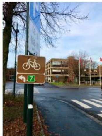
Bilde: sykkelprosjekt i Moss sentrum