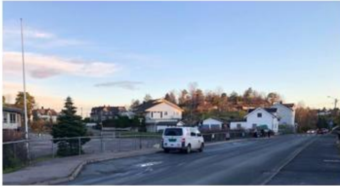
Bilde: Krapfoss skole. Mange myke trafikanter langs en trafikkert vei og en uheldig utformet dropp-soner.

strategiene som er beskrevet og forbedre noen situasjoner som i dag har stort forbedringspotensial. På denne måten vil rapporten både kunne være et oppslagsverktøy for mobilitet- og arealplanlegging, og fungere som en handlingsplan for å forbedre eksisterende situasjoner.