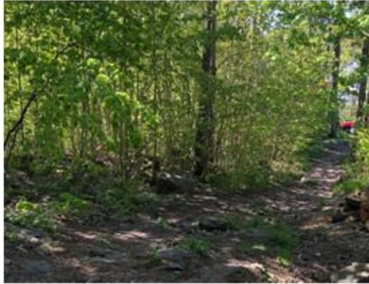
Bilde: Refsnes. Snarvei som brukes av noen få, kan med noen grep gjøres mer tilgjengelig for flere.