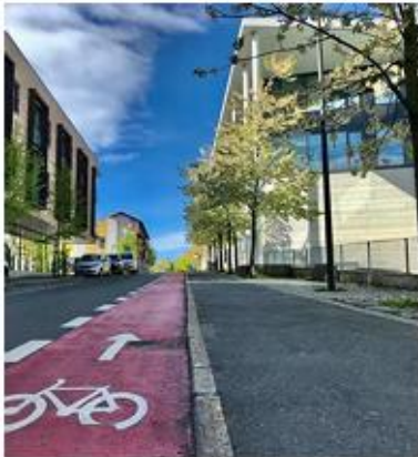
Bilde: Nytt Sykkelfelt i Skoggata.