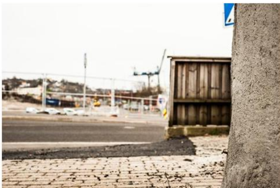
Montering av setningsbolter i grunnmuren på ca. 800 bygninger i Moss for å overvåke eventuelle setningsskader.