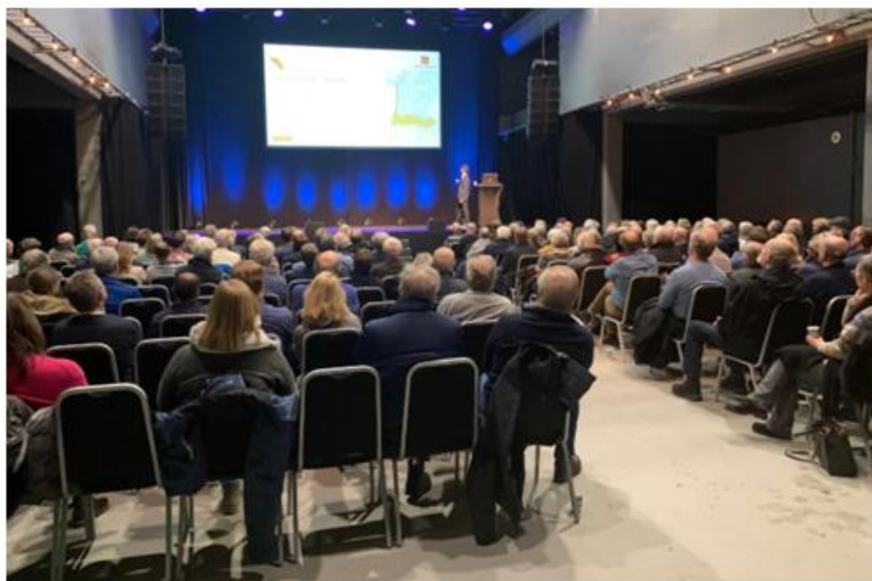
Fullt hus på Verket 2. desember. Prosjektleder Jyar Dara presenterte de alternativene Vegvesenet har valgt å gå videre med for ytterligere og grundigere utredninger.

22. november: Politikermøte på vegkontoret i Moss – foreløpige resultater av silingsrapport. 2. desember: Åpent informasjonsmøte på Verket Scene. Vegvesenet presenterte alternativene som skal utredes.