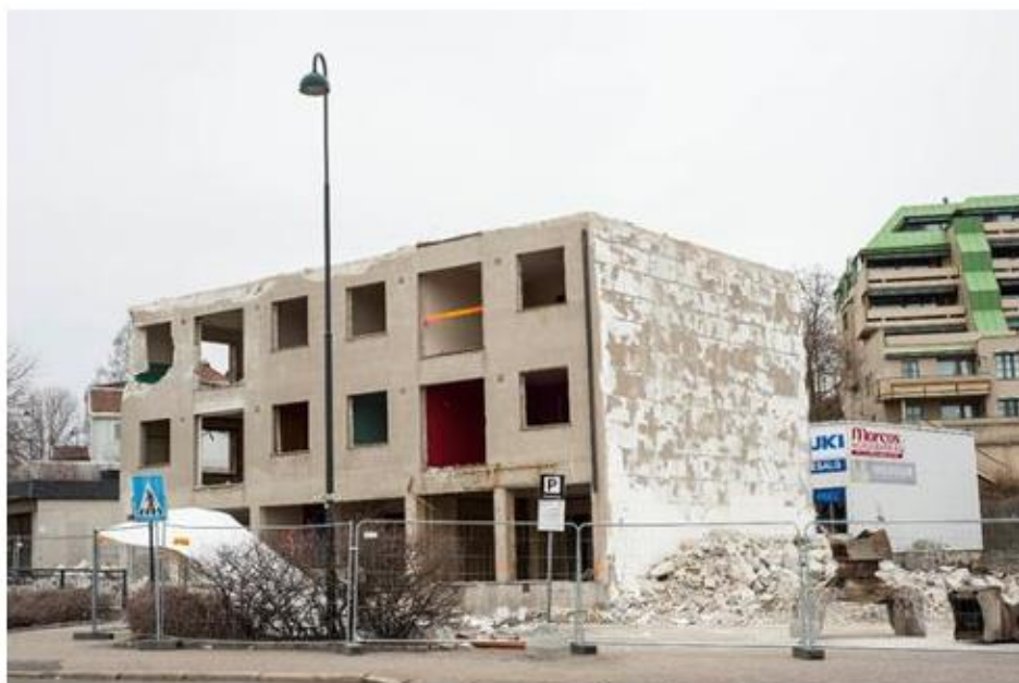
Riving av blokk i Fjordveien ved Kransen-rundkjøringen.