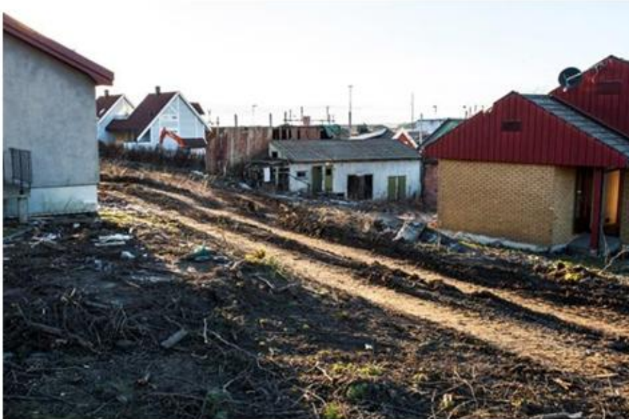
Rivearbeider i Moss i Nedre Tvergate.