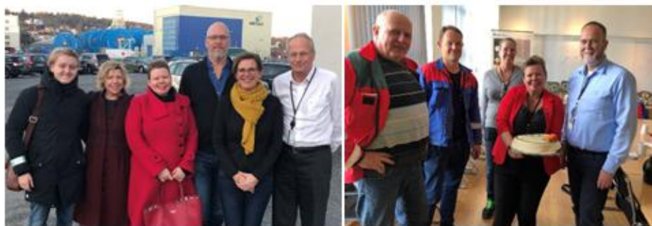
Wärtsilä (Til venstre) og Aker Solutions (til høyre) signerte kontrakt med Miljøløftet Moss om Hjemjobbhjem.

Tiltaksplanene inneholder 17 tiltak i prioritert rekkefølge. I tiltaksplanen er det både fysiske tiltak og tiltak som skal bidra til mindre privatbiltrafikk, spesielt i rushtiden. Hjemjobbhjem-prosjektet og helhetlig parkeringspolitikk er eksempel på tiltak som er igangsatt i 2019. Disse er kort presentert under. Se vedlagt oversikt som viser status for prosjektene i tiltaksplanen for løpende og avbøtende tiltak på rv.19 .