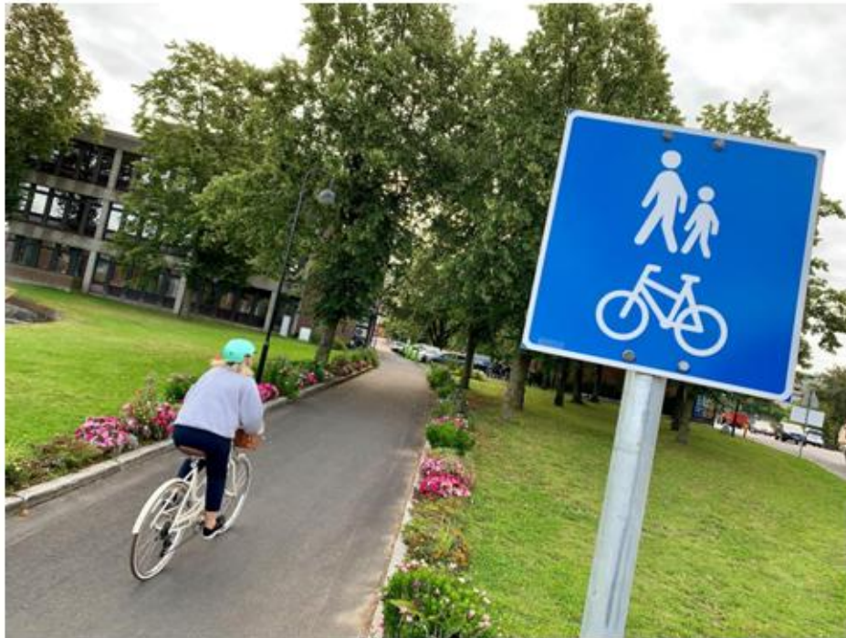
Den nye sykkelveien ved rådhuset er svært populær.