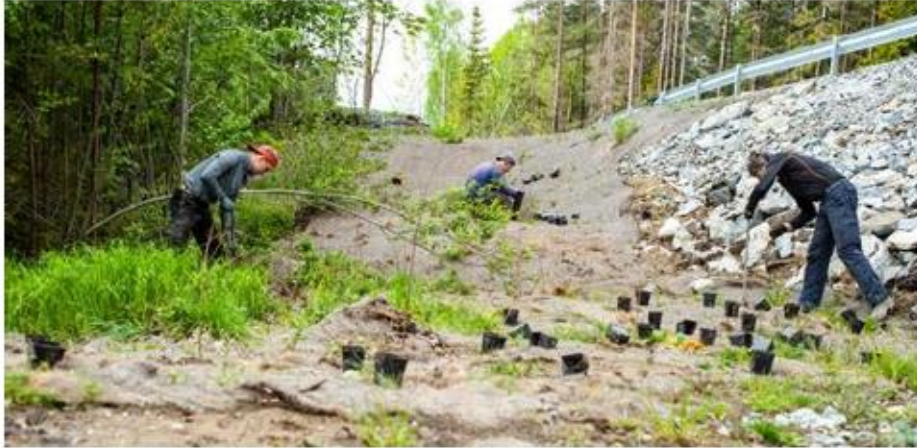
Bane NOR plantet rundt tusen nye trær i Mosseskogen ved anleggsveien som ble etablert i 2018.