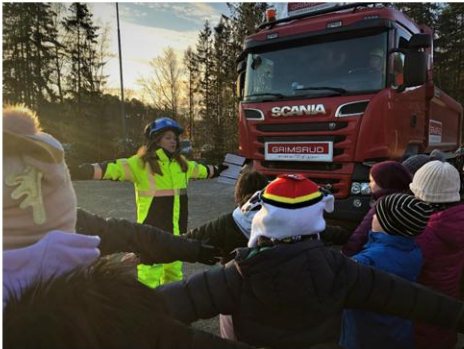
Bane NOR gjennomførte trafiksikkerhetsdag for rundt 600 elever på Verket Skole 7. november.