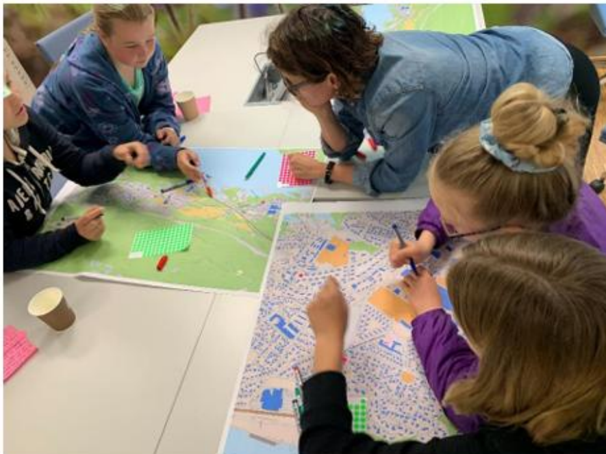
Ungt engasjement – nyttige innspill.

I samarbeid med Moss kommune ble det samlet elever fra 7. og 8. trinn til verksted der de unge fikk markere veiene de hyppigst ferdes og områder de ikke trives med å ferdes i. Dette gav nyttig informasjon om ungdommenes bevegelsesmønstre.