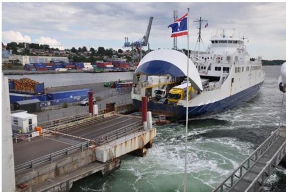
Ferjeleiets plassering har vært gjenstand for diskusjoner.

Prosjektet har holdt den stipulerte fremdriftsplanen, og forslag til planprogram sendes til kommunen i løpet av vinteren/våren 2020. Regionreformen og omorganiseringen i Vegvesenet kan forsinke prosessen noe.