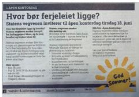
Stort engasjement på Åpent kontor på Bylab.