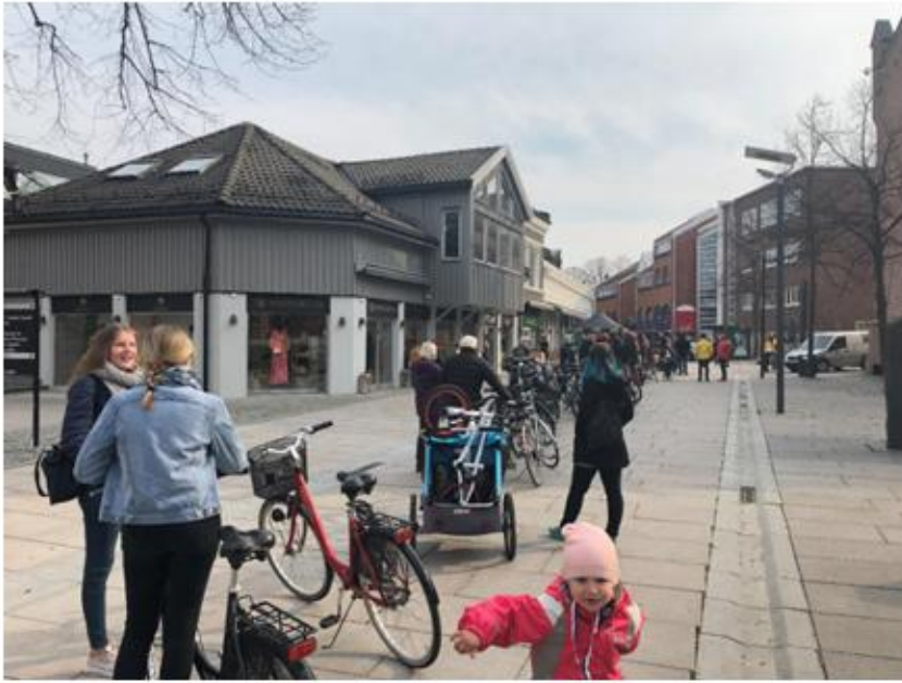
Vår-og vintersjekken er svært populær og det er lange køer for å få sjekket sykkelen.