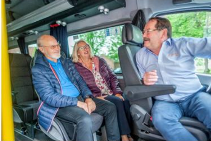
Flex tilbudet ble i 2019 innført i Moss.