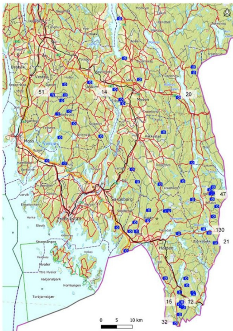
Figur 2: Hjort fotografert av NINAs viltkamera i Østfold i perioden 2012 – 2021. Viltkamera som har tatt mer enn 10 bilder av hjort viser også antallet bilder. Det kan være bilder av hjort som ble tatt i 2021 som fortsatt ikke er med. Grunnlaget for dette kartet er bilder som var lagt ut på NINA sine sider pr 1 mars 2022.

Tidligere Hobøl kommune var den første kommunen i Østfold som åpnet for jakt på hjort i 2012. Etableringen av hjortejakt i fylket har siden skjedd gradvis, i takt med artens økende utbredelse og bestandsvekst. Per 2025 hadde de fleste kommuner i Østfold åpnet for jakt, med unntak av Hvaler, Fredrikstad, Råde og Moss. I mars 2026 åpnet også nabokommunen Vestby for hjortejakt.