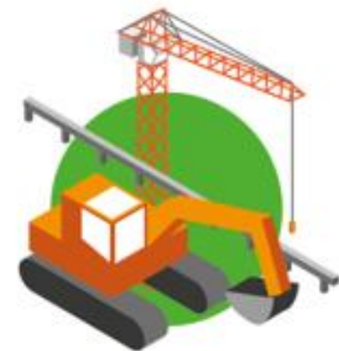
Bygge nytt der vi må