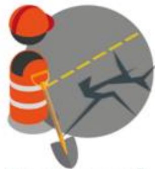
Ta vare på det vi har