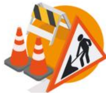
Utbedre der vi kan