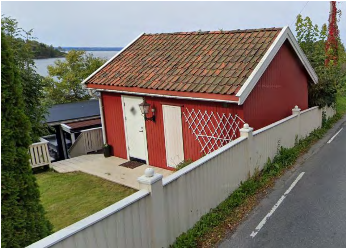
Annekset i Tollbuveien 1