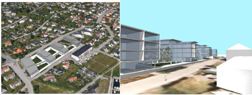
Figur 1 Bygningsutforming V1 Behandlet planinitiativ: Ja til videre arbeid med forutsetning om reduksjon. I dette forslaget var lamellene trukket frem til Bråtengata, med de største høydene nordøst i planområdet. I tillegg innehold konseptet dagligvarebutikk.

Illustrasjoner fra de ulike versjonene. Illustrasjonene er ikke direkte sammenlignbare, da de er utarbeidet med ulike krav til detaljering etter hvor i planprosessen de er sent inn. De kan likevel gi et inntrykk av endringene i prosjektet.