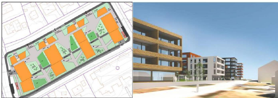
Figur 2 Bygningsutforming V2 Behandlet: avslått. Her er lamellene kortet inn, og det foreslås småhus mot Bråtengata. Bebyggelsen i «mellomrommene» er redusert. Høydene mot Bråtengata er redusert, men høydene mot Syrinveien (øst) er økt. Butikken er tatt ut av prosjektet.