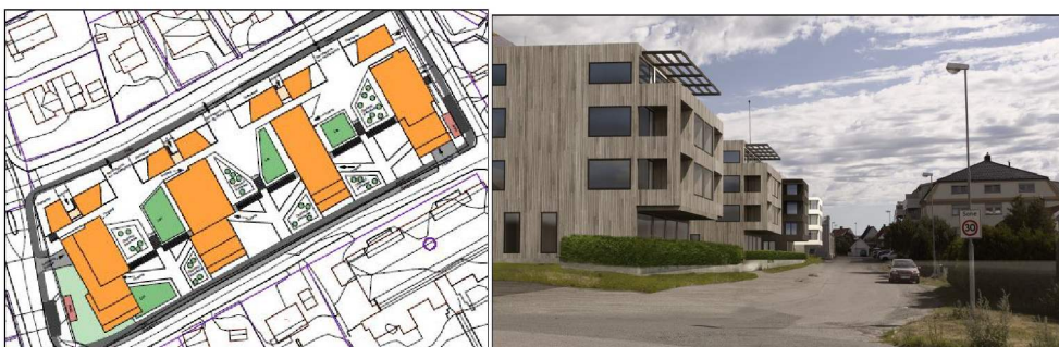
Figur 4 Bygningsutforming V4 Til behandling. Her er høydene ytterligere redusert i hele planområdet, også på småhusene. Lammelsene avtrappes i flere nivå, i takt med terrengets fall. Leilighetene i «mellomrommene» er tatt ut av prosjektet og antallet boenheter er redusert. Uteområdene følger terrenget bedre og oppnår universell utforming. Muligheten til å ha utkragede balkonger er tatt ut.