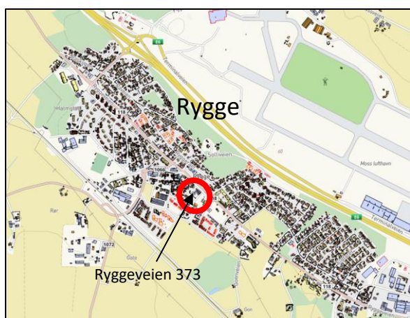
Figur 1. Beliggenhet

Planområdet er ca. 7,2 dekar og ligger ved Ryggevegen på Halmstad i Moss kommune. Oversiktskart som viser lokalisering av området og kartutsnitt med planens begrensning vises nedenfor.