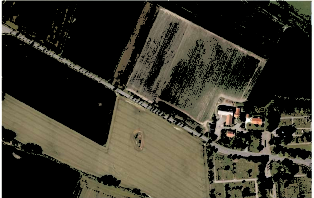
Figur 2 Flyfotoet viser eksisterende situasjon i området. Alleens avgrensning sees på trærne langs veibanen.