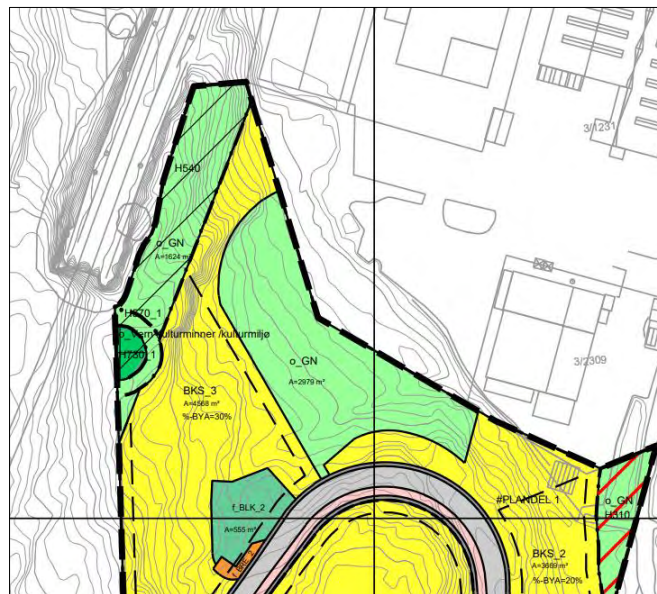
Figur 4: Lekeområde BKL_2 i gjeldende plan endres til naturområde o_GN

I og med at BLK_2 ikke kan opparbeides til lekeplass som regulert, foreslås at dette området avsettes til naturområde/ grønnsstruktur. Området vil fungere som en visuell og fysisk buffer mot næringsområdet i nord, og kan også fungere som en arena for frilek, aking og andre aktiviteter. Det foreslås å legge inn en liten grøntkorridor fra o_kjøreveg til o_GN som gangatkomst fra boligområdene til naturområdet.