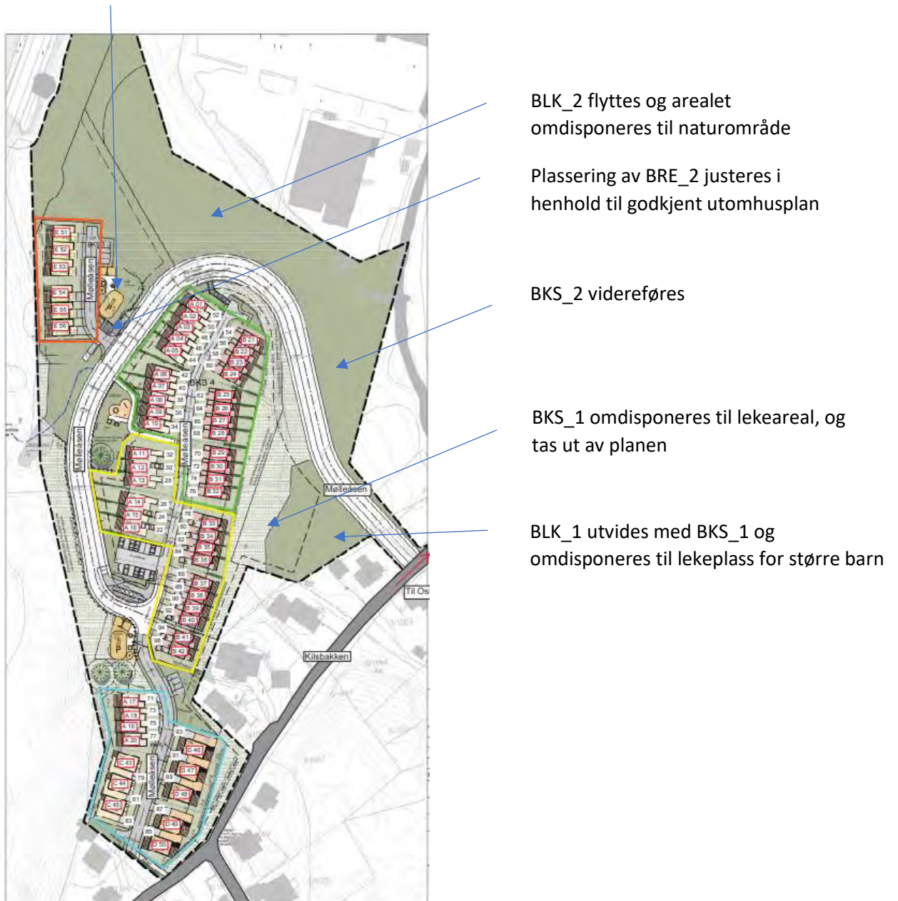
Figur 5. Mølleåsen