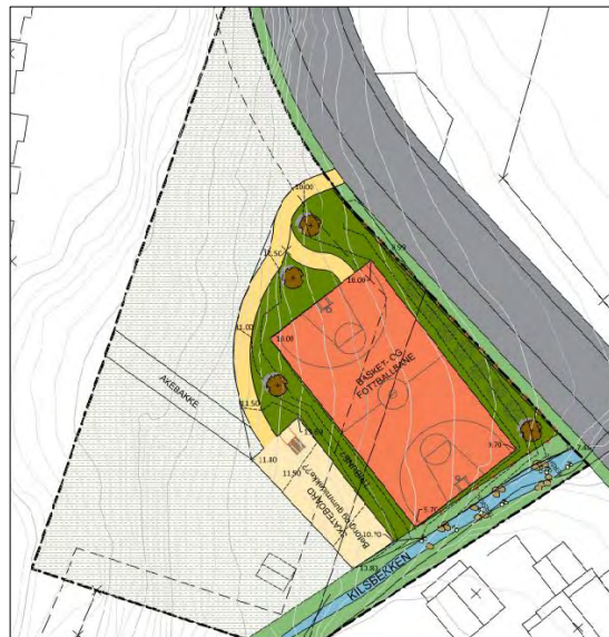
Figur 3: Planlagt utforming av BLK_1

BLK_1 foreslås utvidet med hele BKS_1, og det nye lekeområdet er vurdert og godkjent av geolog. Merknaden fra geologen til en skissert løsning med oppfylling av terreng til akebakke er tatt til følge, og oppfyllingen til akebakke utgår. Selv om oppfyllingen utgår, vil det fortsatt være gode muligheter til aking innen BLK_1. Arealet for BLK_1 øker etter utvidelsen fra 553 m² til 2442 m².